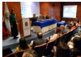
Jornada de inducción

Isleños toman clases de español en la UN