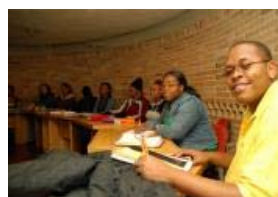
Estudiantes de Barbados y Trinidad y Tobago

Artistas de Canadá y Colombia en IV Temporada de Música de Cámara