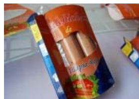
Proyecto beneficiará a acuicultores colombianos

Lista la formulación para hacer salchichas de tilapia