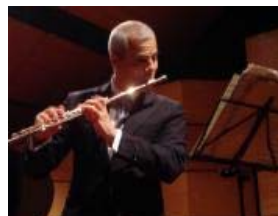
El próximo lunes 27 de julio en UN en Manizales

Lista la formulación para hacer salchichas de tilapia