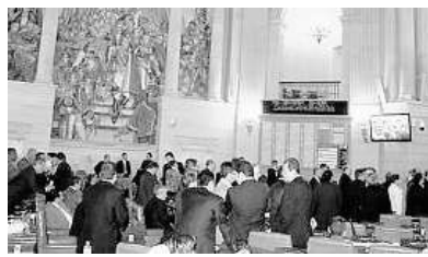
El Senado ya nombró a sus 25 conciliadores. Faltan los de la Cámara.

OPINIE SOBRE ESTE TEMA isoldav@elcolombiano.com.co